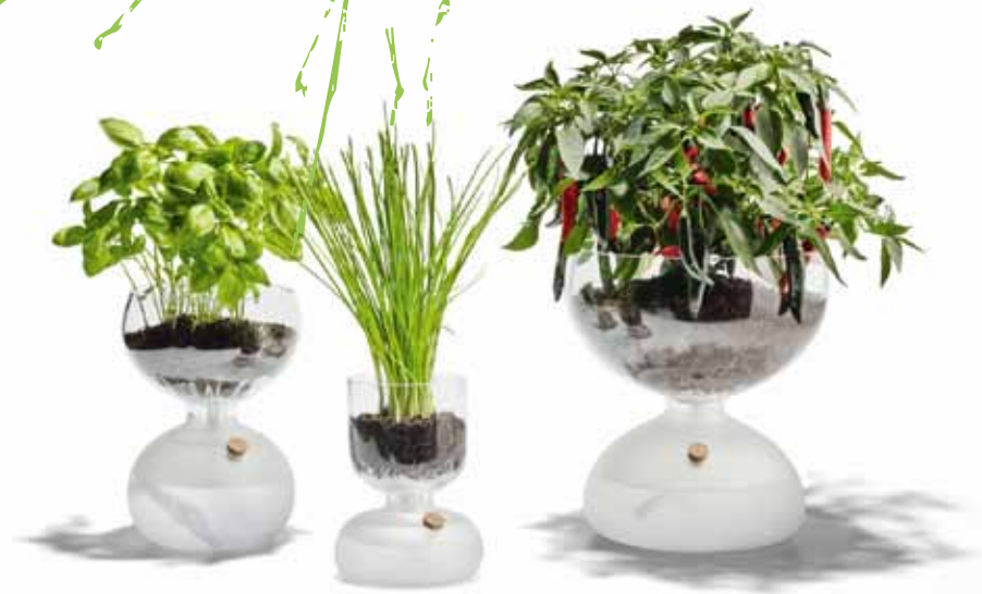
Wasserspender: die selbstbewässernden Schalen von Holmegaard